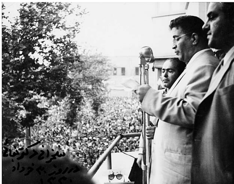
بقایی در میتینگ حزب زحمتکشانشان [۹۰۸-۱۲۴ط]

● عرض کنم که در اردیبهشت یا خرداد ۱۳۴۳ بود. امام تازه از تهران برگشته بودند. قبل از اینکه به ترکیه تبعید شوند اعلامیه‌ای در دلجویی از مهندس بازرگان و دکتر سبحانی صادر کرده بودند. من این طور احساس کردم که اینها با صدور این اعلامیه ممکن است در آینده به نحوی حاکمیت پیدا کنند چون امام مرجعیت دینی داشت و من حدس می‌زدم که در آینده آنقدر صاحب نفوذ می‌شوند که افراد مورد حمایت ایشان در رأس مناصب کشوری قرار می‌گیرند؛ بنابراین، نامه‌ای نوشتم و توصیه کردم که آقا ما در گذشته دیدیم که آیت‌الله کاشانی با حمایت از مصدق خود را خلع سلاح کرد؛ خواهش می‌کنم شما هم با حمایت از این گروه خود را خلع سلاح نکنید. هر تأییدی می‌فرمایید طوری باشد که بتوانید در صورت لزوم حمایت خود را پس بگیرید و خلاصه وضعیت سالهای ۳۱ و ۱۳۳۲ پیش نیاید. در نامه خودم نوشتم که: