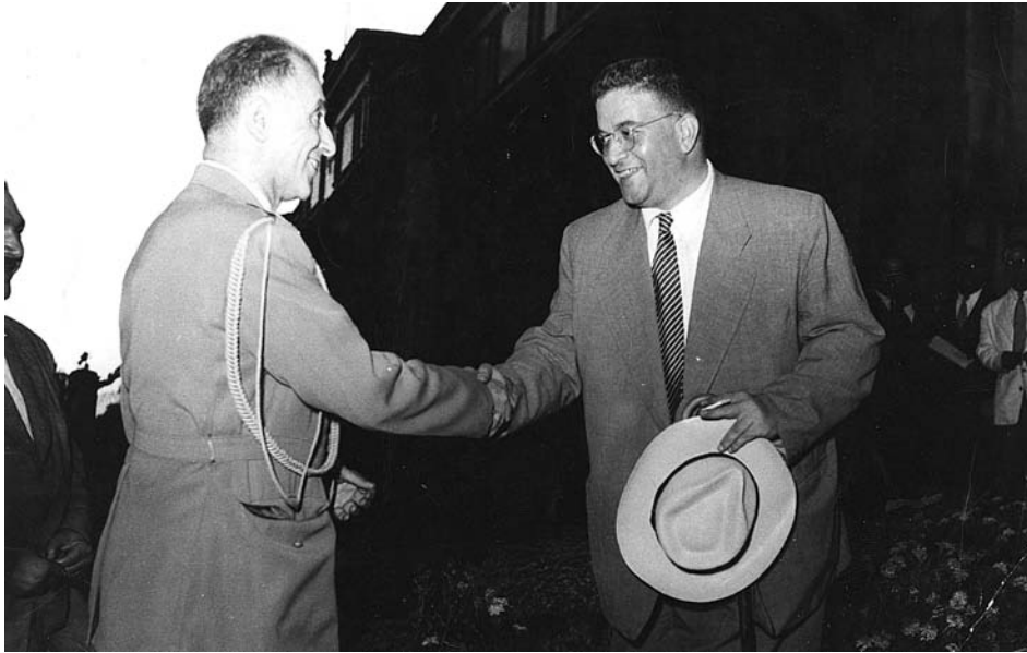
مظفر بقایی و سپهبد فضل‌الله زاهدی [۶۰۹۲-۱۱ع]

را محاکمه و همانجا اعدام کند. من که از این موضوع اطلاع پیدا کرده بودم، به آقای هاشمی گفتم. ایشان فوری متوجه مطلب شد و به کرمان تلفن کرد و مانع از این محاکمه شد و سفارش کرد که دکتر بقایی را آزاد کنند. به این ترتیب اگر آقای هاشمی در این موضوع دخالت نکرده بود خلخالی همان جا دکتر بقایی را اعدام کرده بود. این محبت آقای هاشمی خیلی زیاد بود.