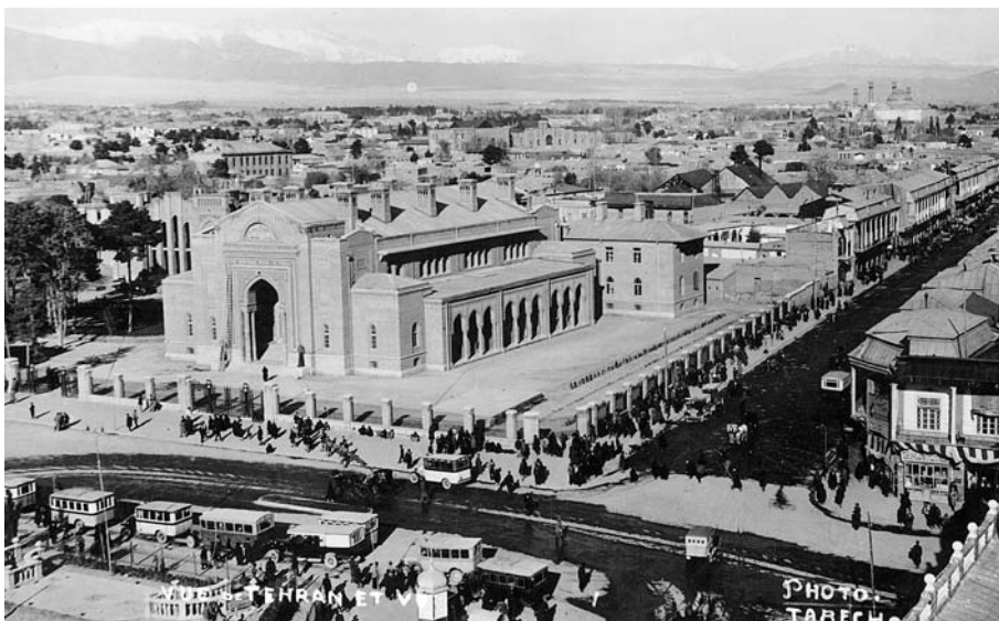
نمای بخشی از شهر تهران و بانک شاهنشاهی ایران در میدان توپخانه [ ۲۸۱۳-۶۱ ]

شیوه‌های پیدا و پنهان در راه شکل‌گیری بانک ملی و نیز شعبه بانک شرقی آلمان در ایران مانع ایجاد کردند. با عنایت به استدلال و فرضیه فوق مقاله حاضر تلاش می‌کند با نگاهی تحلیلی و تاریخی موضع مخالف و البته دشمنانه بانک استقراضی روس با طرح تشکیل بانک ملی و نیز شعبه بانک شرقی آلمان در ایران عصر مشروطه را مورد بررسی و مطالعه قرار دهد، با این توضیح که محور قرار دادن مخالفت بانک استقراضی با شکل‌گیری مؤسسات مالی مذکور به مفهوم نادیده گرفتن نقش مشابه بانک شاهنشاهی در این واقعه نیست که البته بررسی نقش بانک شاهنشاهی در عدم شکل‌گیری و توقف طرح تأسیس بانک ملی و شعبه بانک شرقی آلمان در ایران مجال دیگری می‌طلبد.