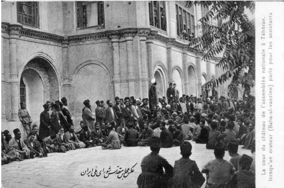
اجتماع جمعی از نمایندگان دوره اول مجلس شورای ملی در محوطه مجلس [ ۳۸۱۴-۱۴ ]

خواهند داد ولی عموم اهالی غیرتمند از تمام ممالک محروسه مجاز و مختار است که در این بانک ملی به قدر قوه خود از ۵ تومان الی هر میزانی که بخواهد وجه داده شرکت نماید قبض و اسهام دریافت داشته و خیر دنیا و آخرتی را برای خود تحصیل نماید. چون تا موقع نوشتن صحیحه و شرایط مدتی لازم است که از روی بصیرت و صحت اعتبار موافق ترتیبات بانکهای ملل متمدنه ترتیبات اساسی بانک فراهم شود و مبلغی عمده فعلاً بر حسب ضرورت و لزوم برای مخارج فوق العاده دولتی که تأخیر و تعویق آن ممکن نیست لازم است عموم اهالی وطن دوست عجله در راه انداختن وجه و رفع احتیاج دولت از استقراض از خارجه داشتند و خواهش نمودند اعلانی نوشته شود و چندین محل برای وجوهات معین شود لهذا این اعلان انتشار داده شد که هر یک از ابناء وطن عزیز که مایل هستند در این بنای مقدس شریک و نام نیک خود را در صحنه روزگار باقی و ثابت بگذارند در ادارات مقرر ذیل وجه اشتراکی خود را برده و تحویل بدهند قبض موقتی که طبع شده با امضاء و مهر اداره بگیرند و همان طور که در قبوضات چاپ شده نوشته شده پس از آنکه اسهام بانک