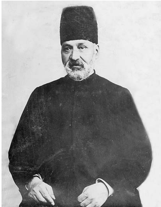
میرزا نصر الله خان مشیرالدوله [ ۳۱۴-۳۱ ] ع

تجاری آلمان در تهران در ۴ ژوئن ۱۹۰۶ در این باره به صدراعظم آلمان چنین گزارش داد: