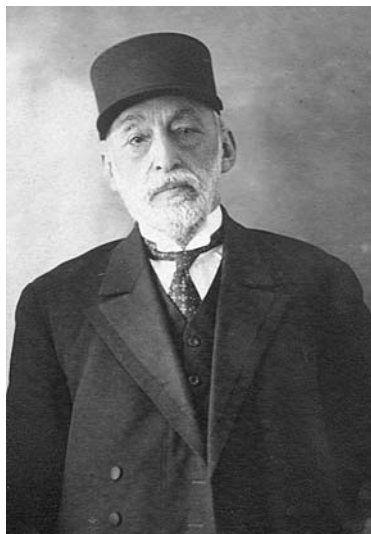
مهدی‌قلی خان مخبر السلطنه [ ۱۵-۴۳۵ ]

مخالفت روس و انگلیس با تأسیس بانک آلمانی در ایران ادامه یافت و نهایتاً از تأسیس و گشایش آن در ایران جلوگیری به عمل آمد. واپسین تلاشهای دولت ایران برای تأسیس بانک آلمانی در ایران به هنگام ریاست‌الوزرای امین‌السلطان بود و گویا او نیز با تأسیس این بانک و کمک مالی آلمانیها برای تأسیس و پاگرفتن بانک ملی موافقت داشت. اما چنانکه از مفاد برخی گزارشات ارسالی سفارت انگلیس به لندن برمی‌آید سفارتین روس و انگلیس به انحاء مختلف برای جلوگیری از تأسیس این بانک آلمانی در ایران کارشکنی می‌کردند. ۶۴ مهدی‌قلی هدایت (مخبر السلطنه) هم در ذکر مهم‌ترین دلایل عقیم ماندن تلاش آلمانیها برای تأسیس بانکی در ایران به مخالفت روس و انگلیس اشاره کرده و می‌نویسد: «عین‌الدوله سرسری مواعیدی به سفارت آلمان راجع به افتتاح بانکی کرده بود، در کابینه اتابک اجرای آن مواعید را می‌خواستند، ناصرالملک وزیر مالیه هیچ‌گونه جوابی به سفارت نمی‌داد.