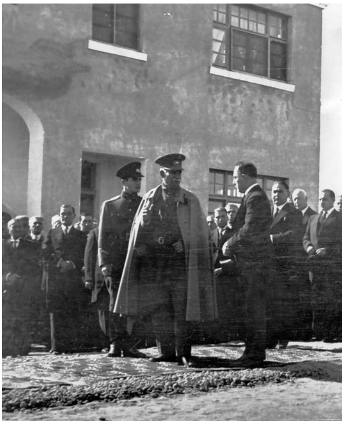
رضاشاه و محمدرضا پهلوی در بازدید از سیلوی تهران (۱۳۱۶)؛ علی اکبر داور، محمود جم و علی اصغر حکمت حضور دارند [۱۳۰۴۷۶-۲۷۵م]

از این نظر می‌باشد که مرگ داور به طرز تأسف آوری در صحنه سیاست کشور ایران احساس می‌شود. ترس و وحشت ناشی از مرگ وی در میان همکاران وی چنان اثری گذاشته که وزیران جرئت نمی‌کنند کمتر مسئولیتی را بپذیرند و تصمیم‌گیری در مورد ساده‌ترین و کم‌اهمیت‌ترین امور را از این کمیسیون به آن کمیسیون حواله می‌کنند. بدین ترتیب هرچند بودجه سال، قبل از عزیمت رضاشاه به جنوب به تصویب مجلس رسیده بود ولی هیچ هزینه‌ای تا مراجعت شاه به تهران پرداخت نگردید و یک چنین وضعیتی بیش از یک ماه پرداختها را دچار تأخیر کرد. برای پی بردن به حالت وحشتی که