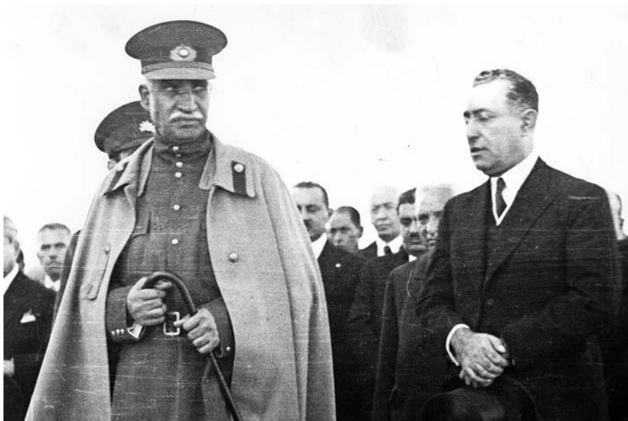
رضاشاه و علی اکبر داور (۱۳۱۵) [۱۳۰۴۳۸-۲۷۵م]

بلکه باز این سیاست در ایران توسعه یابد. البته سیاست اقتصادی تهاتری ملموس می‌باشد و به این جهت هم تلاش چندانی برای از میان برداشتن آن نمی‌شود؛ چون یک راه‌حل ساده و بدون زحمت برای تجارت به نظر می‌رسد؛ مهم‌تر اینکه این روش به مزاج مسئولان امور اقتصادی کشور ایران سازگارتر است. آنان با توسل به این سیاست دیگر مجبور نیستند با پادشاه ایران در مورد گرفتن وام، تهیه ارز خارجی و مذاکرات جدیدی که بر ایشان نتیجه خطرناکی دربردارد، گفت‌وگو کنند. چنانچه نمایندگان دولت آلمان بتوانند از این نقطه ضعف روحی مسئولان ایرانی سود جویند، بدون تردید، قادر خواهند بود منافع هنگفتی را از این کشور به دست بیاورند.