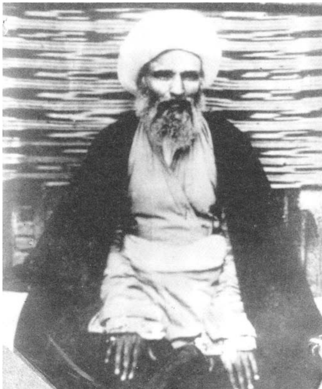
آیت‌الله آخوند محمدکاظم خراسانی [ ۴-۷۷۰ ]

(و این نظریه غالب فقهای گذشته بود) فقها آمدند در آن شرایط نظریه‌پردازی و تجویز سلطنت کردند. تجویز سلطنت شد گفتمان حاکم. تا دوران مشروطه این گفتمان بر حوزه‌های شیعه حاکم بود و با شروع مشروعیت که گفتمان تحدید (محدودسازی) حکومت مطرح شد؛ یعنی فقهای شیعه که آغازکننده آنها هم آخوندخراسانی است در واقع این نظریه را ابداع کردند که حکومت نمی‌تواند مطلقه باشد. حکومت باید محدود بشود. سلطنت نمی‌تواند مطلقه باشد. یک شخص به نام سلطان و شاه نمی‌تواند در رأس همه ملت همه اختیارات را داشته باشد و هیچ محدودیتی در اختیارات او نباشد؛ یک غیرمعصوم باید سلب اختیارات بشود، و فقط در یک حدی به او اختیارات داده شود؛ و این شد گفتمان تحدید اختیارات حکومتی، و این شد مبنای انقلاب مشروطیت ایران. همین نظریه که یک شخص نمی‌تواند سالار باشد؛ مردم باید سالار باشند، یا حداقل، شخص سالاری باید با مردم‌سالاری تکمیل بشود توسط فقهای بزرگ شیعه و در رأس آنها آخوندخراسانی مطرح شد و شاگردان آخوندخراسانی، از جمله مرحوم میرزای